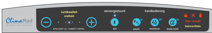
Bedienfeld Typ I

Ihren Radiator bedienen Sie wie immer mit dem Radiatorknopf an der Seite. Die ClimaRad-Lüftungseinheit wird mit dem Bedienfeld an der Oberseite des Radiators bedient.