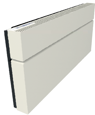
ClimaRad Care H1C