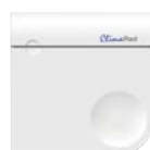
CO 2 -sensor

über den externe CO 2 -Sensor (optional) (Standardeinstellung: 1.000 ppm)